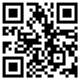
ข้อมูลนิทรรศการ ภาษาไทย

๓.๓ การจัดตั้งนิทรรศการ ของหลวงปู่มั่น ภูริทัตโต ตามวัด/สถานที่ต่าง ๆ ที่สร้างถวายเป็นพุทธบูชา ประกาศคุณงามความดีของพระคุณขององค์ท่าน ทั้งในและต่างประเทศ ขอความร่วมมือจัดตั้งไว้ตามวัด สถานศึกษา อย่างน้อยเป็นระยะเวลา ๖ เดือน ถึง ๑ ปี