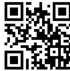
ข้อมูลนิทรรศการ ภาษาอังกฤษ