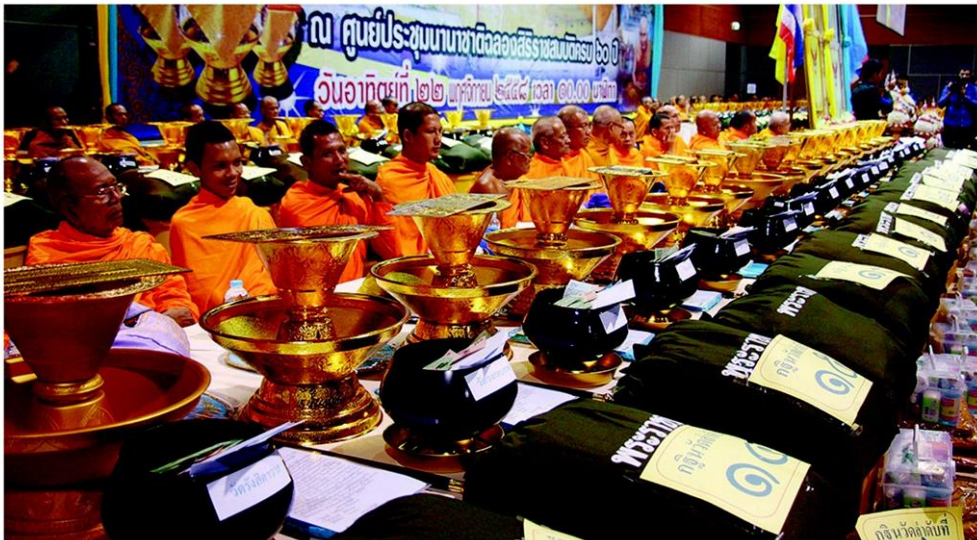
พระสงฆ์จากจังหวัดชายแดนใต้ได้รับพระกฐินพระราชทาน