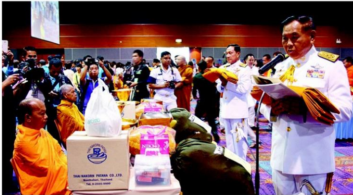
พลเอก ณพล บุญทับ ถวายผ้าพระกฐิน