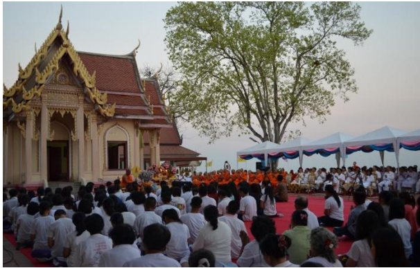
นครสวรรค์