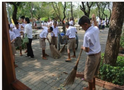
กำแพงเพชร