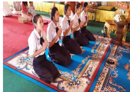
เชียงราย