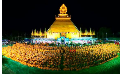
ศรีสะเกษ