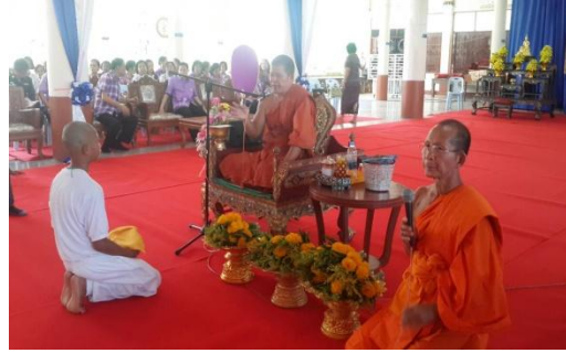
สิงห์บุรี