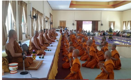
กาฬสินธุ์

เด็ก เยาวชน และประชาชนร่วมเทิดทูนสถาบันพระมหากษัตริย์ น้อมนำหลักธรรมทางศาสนา ไปประพฤติปฏิบัติ และสืบทอดอายุพระพุทธศาสนา