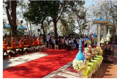
เชียงราย